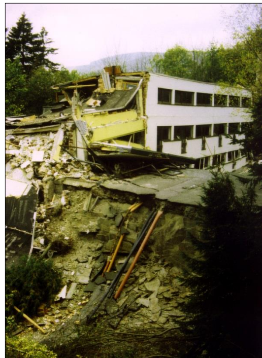
Bild 3: Zerstörter Wohnkomplex durch Verbruch von Abbauen der Fredeburger Dachschieferlagerstätte

Medienwirksam war auch das Verbrucherereignis in der Wohnsiedlung Höntrop in Bochum-Wattenscheid am 02.01.2000. Über Nacht entstand ein Krater von 40 m Breite und Tiefe, dabei verschwand eine Garage samt Auto. Am nächsten Tag folgte eine weitere Garage. Im Bereich des 1905 stillgelegten Steinkohlenschachtes 4 der Zeche Annemarie traten plötzlich erhebliche Massenbewegungen in der alten, verspiegelten Schachtröhre auf, worauf sich an der Geländeoberfläche eine Hohlform von mehr als 7 500 m 3 einstellte, die mit Beton verfüllt werden musste. 20